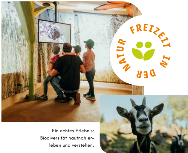
Ein echtes Erlebnis: Biodiversität hautnah erleben und verstehen.